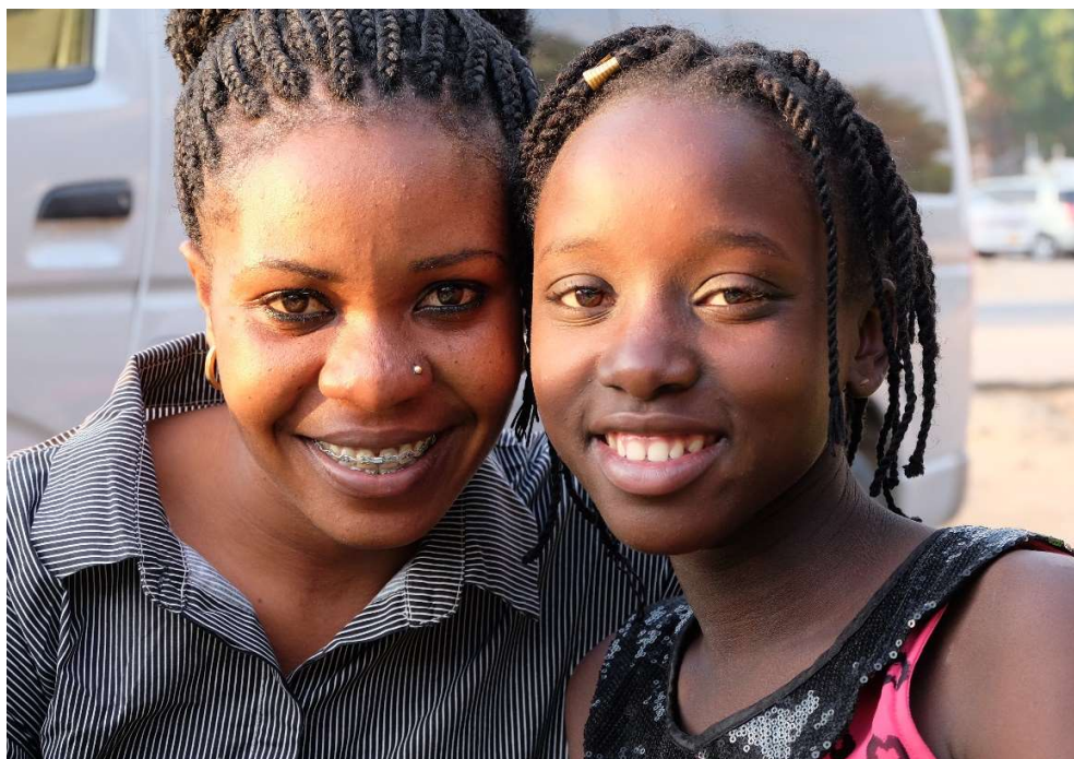
ALJECO, EEN THUIS VOOR KINDEREN