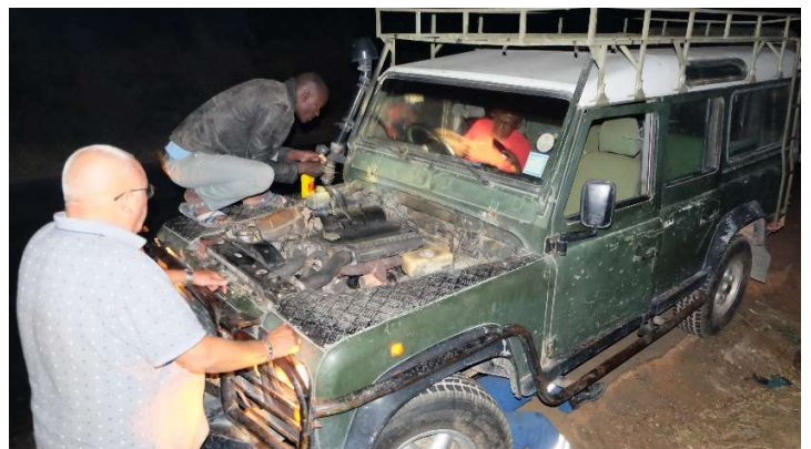
'Never a dull moment!'

Daar stonden we dan, stil op ca. twee en een half uur rijden van Dodoma. Gelukkig Kawawa kunnen verwittigen, samen met een maat is hij onze kant opgekomen en is de boel gerepareerd. Om 00:30 arriveerden we nabij ALJECO.